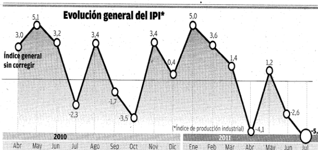
Tasa media del IPI (Índice por CC AA)

En el conjunto del Estado, la producción industrial de julio cayó un 5,7% respecto al séptimo mes de 2010, tres puntos porcentuales más que la tasa registrada en el mes de junio, cuando cayó un 2,6%. Con este descenso la actividad industrial nacional suma dos meses en negativo, tras repuntar en mayo (1,2%), y experimenta su mayor caída desde octubre de 2009, cuando se desplomó un 12,8%. La variación me-